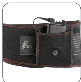
kapsa na powerbanku vrecko na powerbanku pocket for powerbank kieszka na powerbank