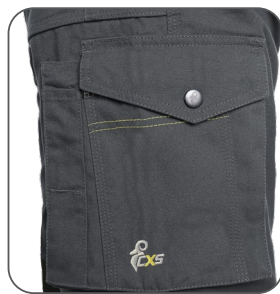
multifunkční kapsy na boku multifunkčné vrecká na boku multifunctional side pockets boczne kieszenie wielofunkcyjne