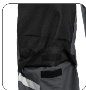
kolena s možností vložení výstuh kolena s možnosťou vloženia kolenných výstuh knees with possibility to insert pads kolana z możliwością włożenia nakolanników