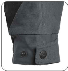
regulace manžety rukávu regulácia manžety rukáva sleeve cuff adjustment regulowany mankiet