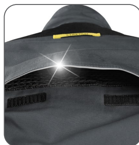
ventilace na zádech vetranie na zadnej strane ventilation on the back wentylacja z tyłu