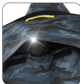
ventilace na zádech vetranie na zadnej strane ventilation on the back wentylacja z tyłu