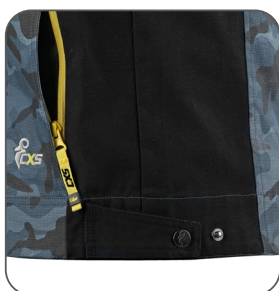
regulace v pase regulácia v páse adjustable waist regulowany pas