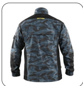
zadní strana zadná strana back side z tyłu